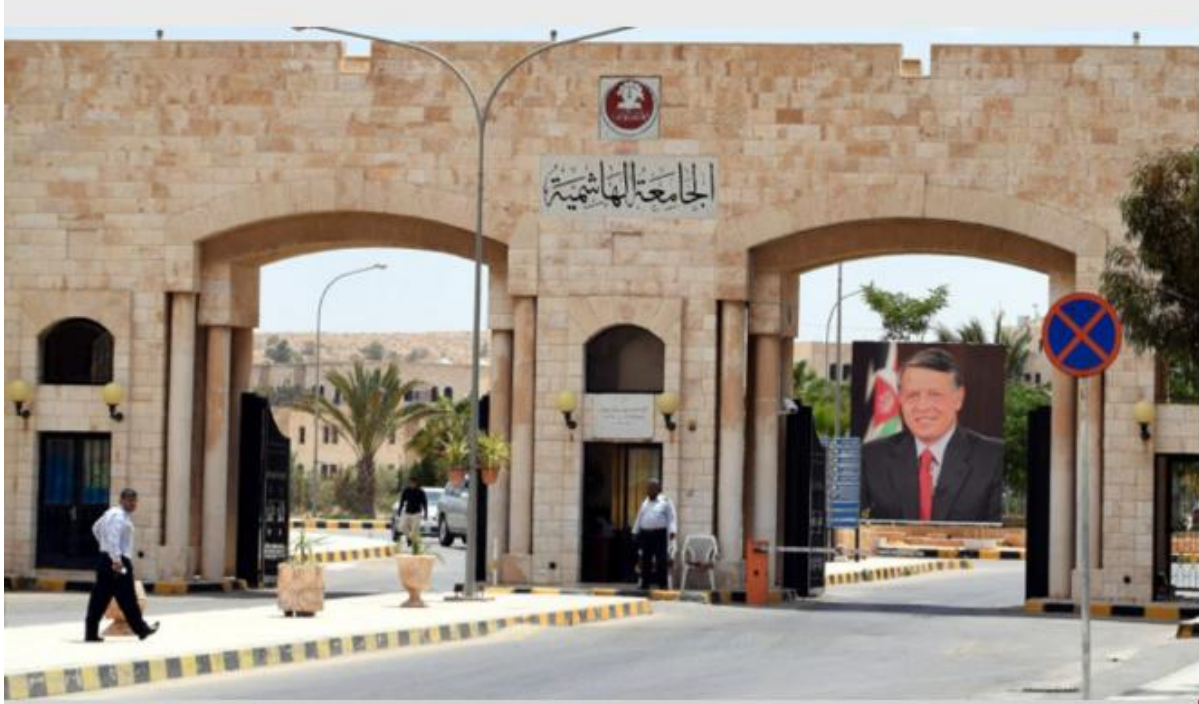
مبنى الجامعة الهاشمية

تاريخ الإنشاء 2026-04-28 15:23:07 آخر تحديث 2026-04-28 16:03:27